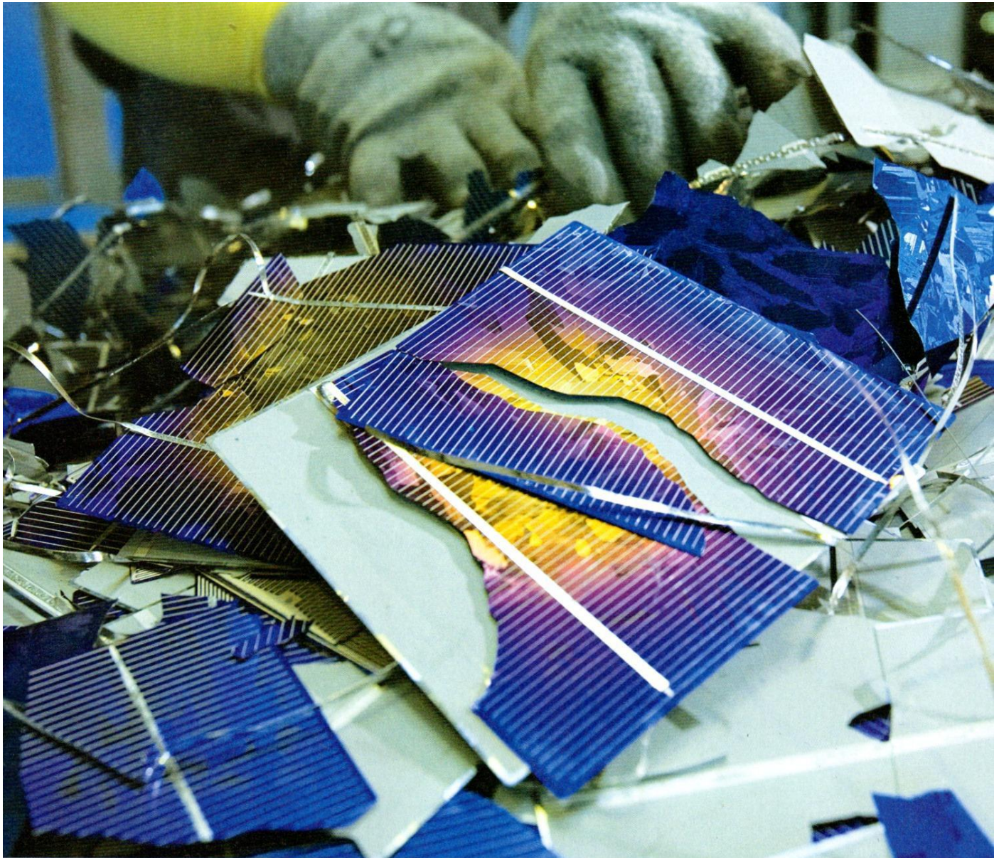
Blaues Altglas: Ein Mitarbeiter bei Solarworld im sächsischen Freiberg sortiert Zellbruch für die Rohstoffaufbereitung.

ropäische Photovoltaik Industrieverband Epia hatte zusammen mit dem Bundesverband Solarwirtschaft (BSW) der EU rechtzeitig signalisiert, dass man ein freiwilliges Sammel- und Entsorgungssystem aufbauen werde. Zwei Fliegen mit einer Klappe will man so schlagen: Ein freiwilliges Recyclingssystem wäre ein Imagegewinn für eine ganze Industriebranche. Und unter vorgehaltener Hand fürchtet die Solarbranche sich vor den Kosten und der Bürokratie, die WEEE verursacht.