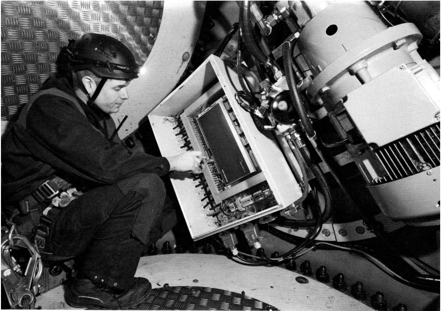
Unabhängiger Blick gefragt: Die freien Serviceanbieter erhielten in der aktuellen Umfrage gute Noten. Hier wartet ein Mitarbeiter der Deutschen Windtechnik das Pitch-System in der Nabe einer Vestas NM82/1500.