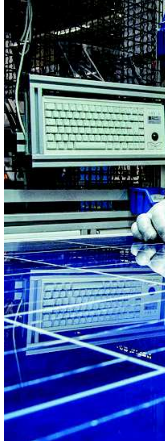
Fehleranalyse: Bevor neue Solarmodule das Werk verlassen,

Dank ihrem hohen Wirkungsgrad lässt sich die Technik platzsparend installieren und eignet sich somit für Standorte, an denen viel Power auf engstem Raum gefragt ist. In Japan etwa, wo für die Solarenergie oft nur kleine Dachflächen zur Verfügung stehen, sind Rückseiten-sammler sehr beliebt. Auch Energieversorger in