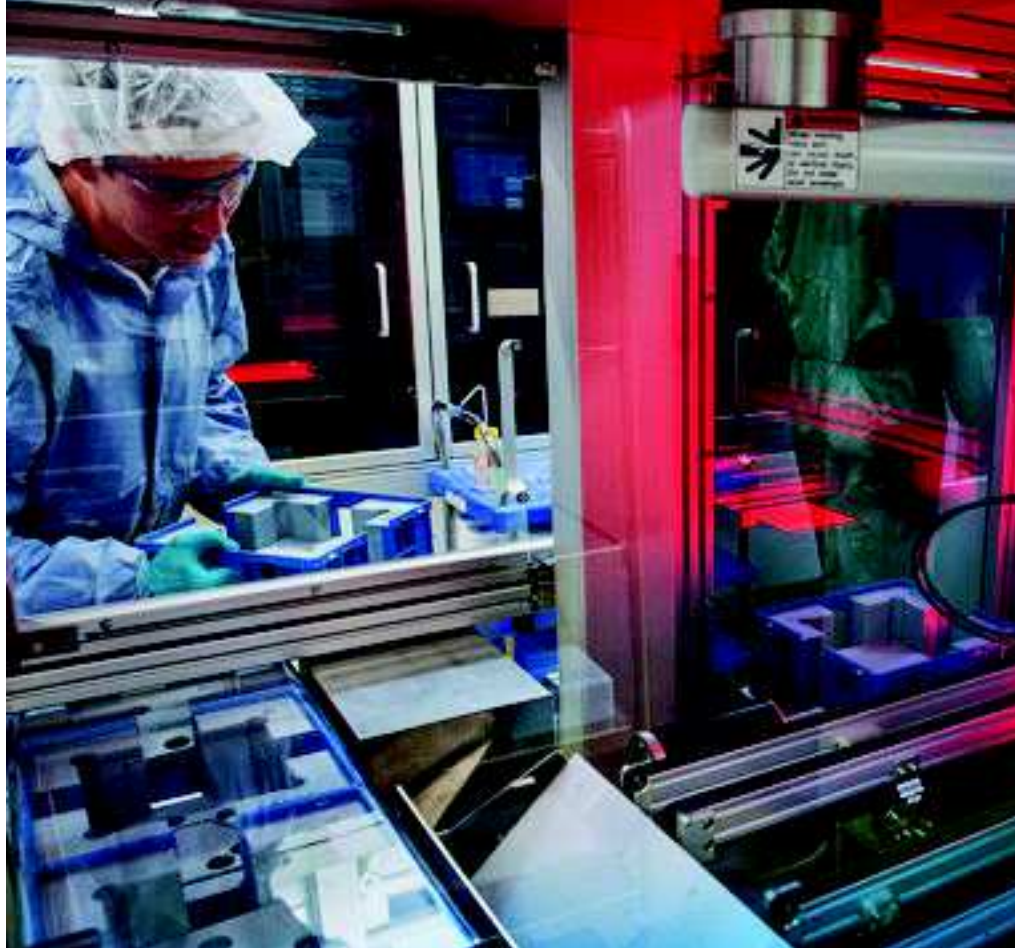
Gut genug? Am Ende moderner Produktionen werden die Solarzellen nach Wirkungsgraden sortiert.

Zufrieden sind die First-Solar-Entwickler mit ihrer Technik aber noch nicht: Im August vorigen Jahres erzielten sie einen neuen Effizienzrekord für Dünnschichtmodule von 21 Prozent. Diesem Wert wol-