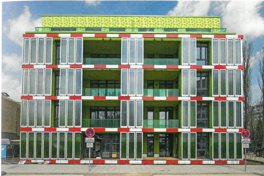
Algenhaus: In der Fassade des „Hauses mit Biointelligenzquotient“ in Hamburg erzeugen Algen per Photosynthese Wärme für die Wohnungen.