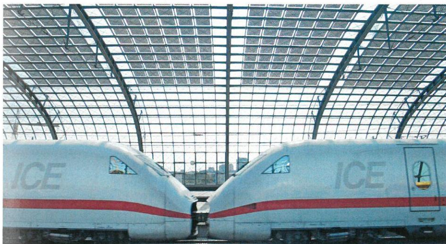
Praxiserprobtes Vorzeigeprojekt: Das Dach des Berliner Hauptbahnhofs verdeutlicht die Vorzüge der BIPV: Die Module erzeugen Strom und lassen zugleich Licht passieren.