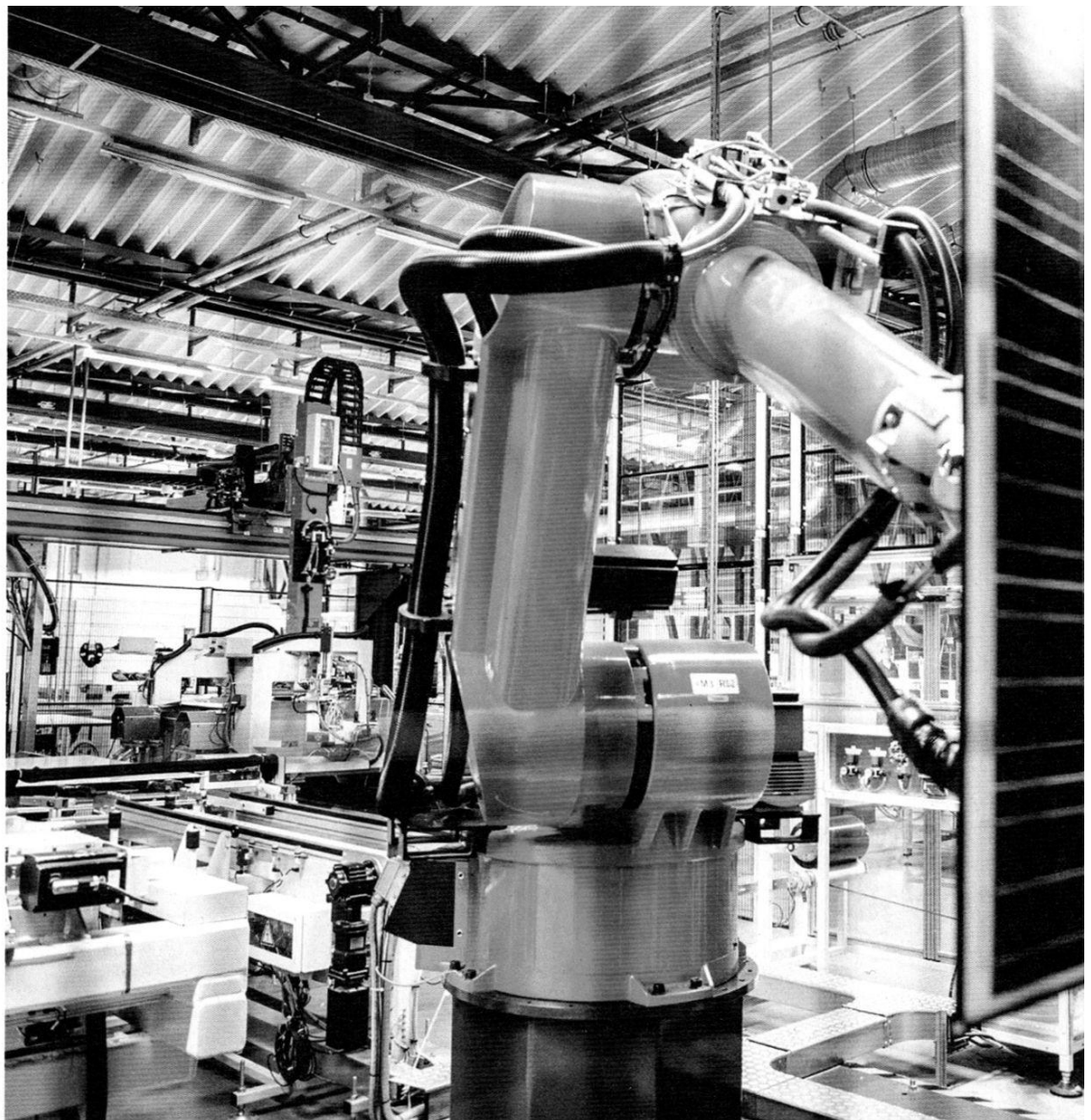
Roboter übernehmen: Durch zunehmende Automation sinken die Fertigungskosten in Solarproduktionen.

schaftsstelle der EU-Kommission untersucht, unter welchen Bedingungen eine solche Großproduktion in Europa aktuell Sinn ergeben würde. Die Hürden sind nach dem Ergebnis der Untersuchung allerdings technisch wie finanziell immens. Zwar böte der wachsende Weltmarkt genügend Absatzchancen, doch um mit chinesischen Produktionen konkurrieren zu können, müsste die Gigafab mit einer Produktionskapazität von mehreren Gigawatt konzipiert werden und kurzfristig Module zu Kosten von weniger als 0,40 Euro pro Watt hervorbringen, erklärt der Photovoltaikexperte Ar-