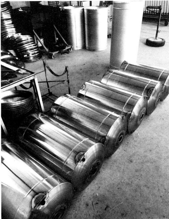
HANDARBEIT: Tanks für die Kalt- und Warmwasserspeicherung.