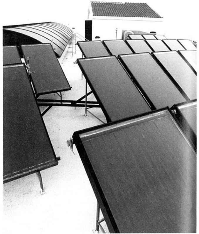
HÄUFIGES BILD: Flachkollektoren auf Hoteldächern.