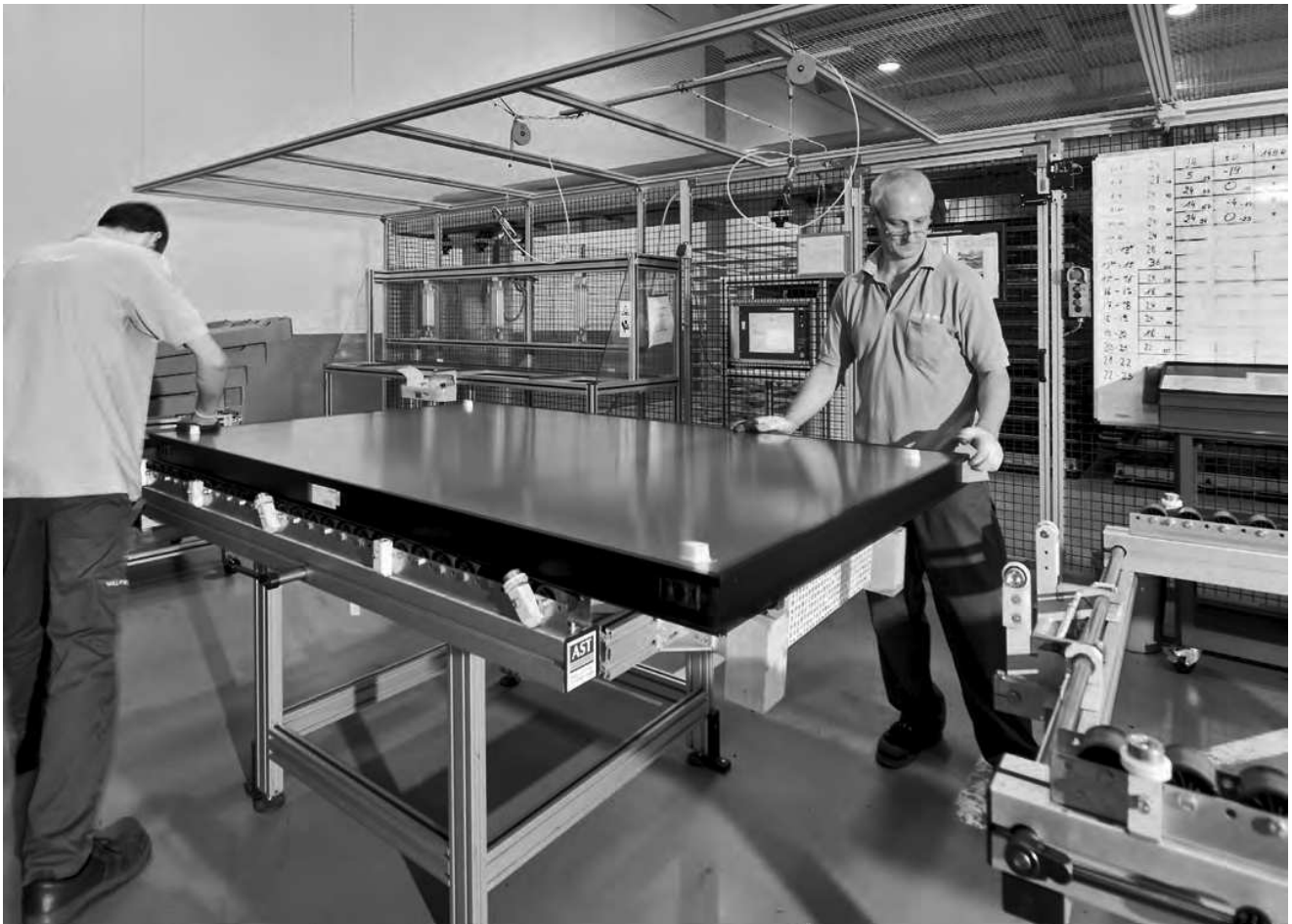
Ladenhüter: Der Absatz von Solarthermie ist in Deutschland weiterhin zäh. Bei Vaillant laufen Ökowärmeerzeuger nur im Paket mit Gas- und Ölthermen.

erneuerbare Energien auch auf den Gebäudebestand auszuweiten. Andere Branchenvertreter fordern eine CO 2 -Steuer. Die Idee: Wer Öl und Gas verheizt, zahlt für seine Emissionen. Das schafft Anreize, in Ökowärme zu investieren. Auch gibt es bereits Forderungen, das MAP komplett abzuschaffen. Es habe, so Paradigma-Ingenieur Griebhaber, sehr negative Einflüsse auf den Markt. „Wird es gekürzt, wenden sich die Leute ab, steht eine Erhöhung an,