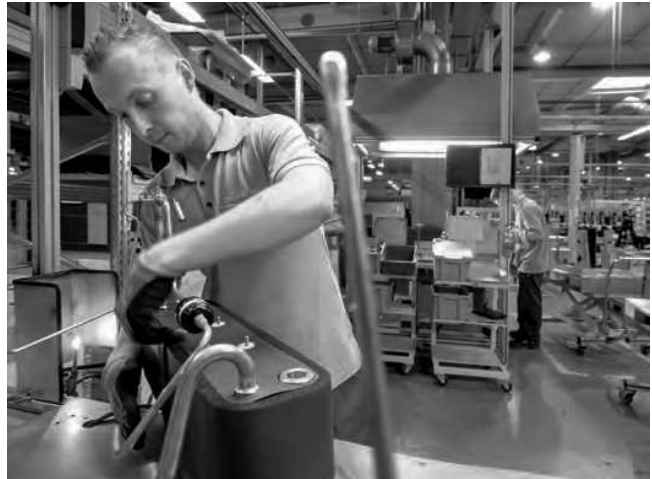
Roboter aus der Autoindustrie: Nach dem Boomjahr 2008 investierten wie Vaillant viele Thermie-Hersteller in die Modernisierung ihrer Kollektorproduktion. Die Automatisierung hat allerdings ihre Grenzen.