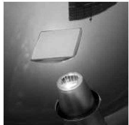
Feldforschung: Weltweit sollen Solarparks mit Konzentratorsystemen entstehen. Bevor es soweit ist, werden sie genau getestet.

Doch Soitec muss mit starken Wettbewerbern rechnen. Zu den schärfsten Konkurrenten zählen Amonix und Solarfocus. Ehe Semprius mit seinem Rekordmodul ins Spiel kam, teilten sich Amonix und Soitec den Moduleffizienzrekord von 30 Prozent. Arima Eco wiederum setzte