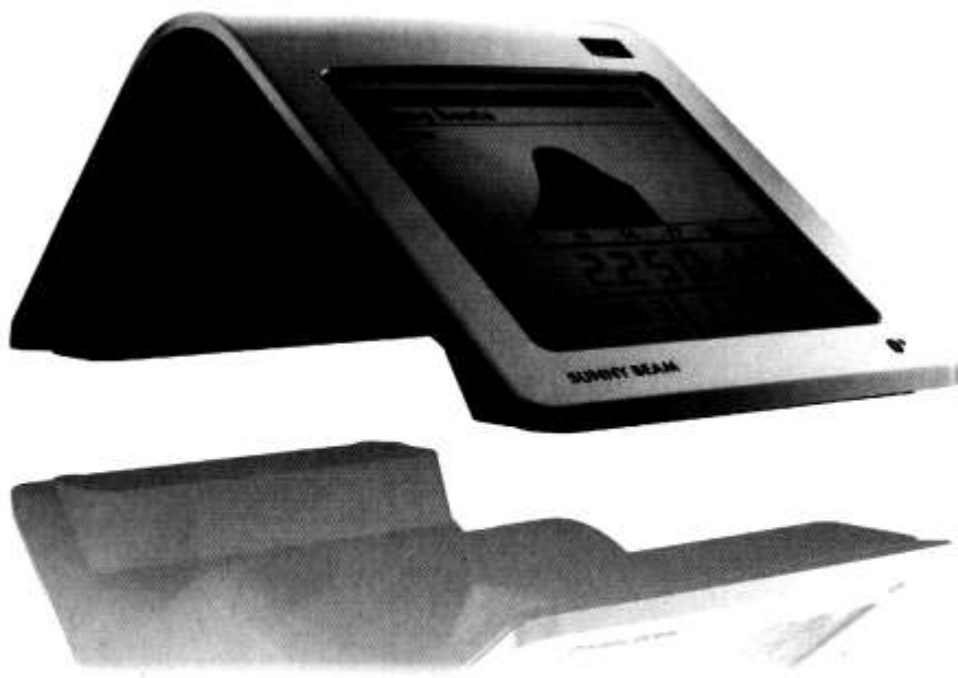
Sunny Beam von SMA