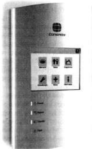
VisionBox von Conergy

Detailliertere Analysen sind mit Datenloggern möglich, die mit den großen Servern etwa von Meteocontrol oder SMA kommunizieren können. Dies sind neben Modellen der beiden Firmen selbst zum Beispiel Geräte der Wechselrichterhersteller Kaco und Sunways. Die Portale simulieren anhand individueller Anlagenparameter, die ihnen die Datenlogger zuspiesen, sowie zusätzlichen Wetter- und Satellitendaten den Sollwert eines Kraftwerks und vergleichen ihn mit den Istwerten. Liegt die tatsächliche Stromproduktion um einen vorab definierten Prozentsatz unter dem Sollwert, wird der Anlagenbetreiber benachrichtigt. Die ausgeklügelte Software sorgt dafür, dass Alarm auch wirklich nur im Ernstfall ausgelöst wird. Um etwa Fehlalarme durch Schnee zu vermeiden, wertet das Meteocontrol-Portal die aktuelle Schneesituation einer jeden Anlage aus. Liegt Schnee, wird kein Alarm versendet. Wie oft der Soll-Ist-Vergleich vorgenommen wird und wie viel Zeit somit zwischen Fehler und Fehlermeldung vergeht, ist eine Frage des Sicherheitsbedarfs und des Geldes. „Unser Server kann alle 15 Minuten bis täglich simulieren“, sagt Rascher von Meteocontrol.