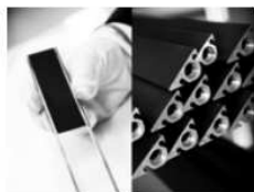
„Double Solar Technology“ ist das Hybridsystem speziell für Wärme-Grossabnehmer der schwedische Firma Absolicon.