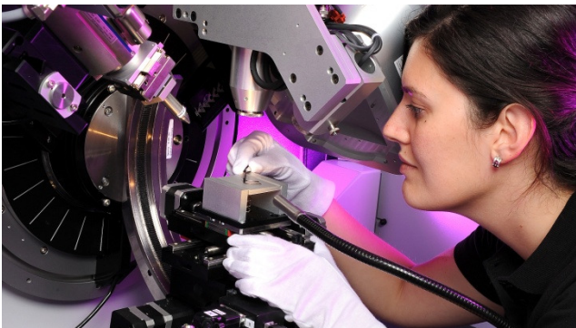
Neues Standbein: Für eine intelligente Energieversorgung muss Sonnenstrom gespeichert werden. Maschinenbauer forschen daher neuerdings auch an Batterien.