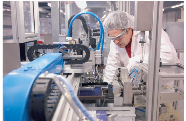
Nur Zuschauer: Dank rascher technischer Fortschritte der Solarmaschinenbauer läuft die Produktion von Solarzellen heute bei vielen Herstellern vollautomatisch ab.