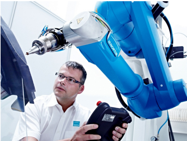
Vielseitig einsetzbar: Laser sind aus der Solarproduktion nicht mehr wegzudenken. Neueste Technik schafft gleich mehrere Prozessschritte in kürzerer Zeit.